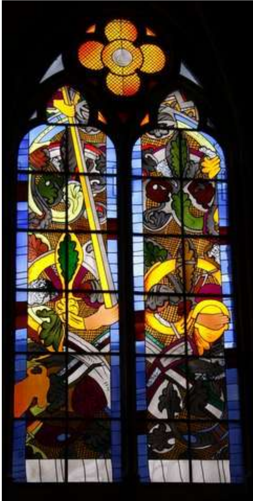
Abraham en Izaak, Kathedraal Nevers; Foto: E.M.P.P. Verhey

Informatieblad van de Oud-Katholieke parochie Amersfoort